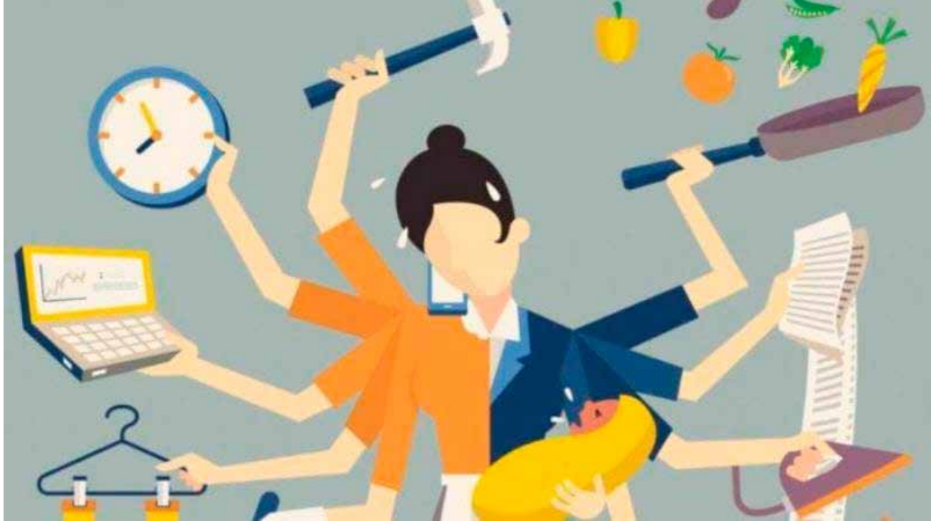
IMAGEN: YO MAMÁ, YO MAESTRA

La lección más importante que podríamos extraer de los testimonios aportados por las maestras-madres es que, durante el confinamiento, en medio de la incertidumbre, el temor al contagio y la inestabilidad propia del acontecimiento pandémico, enseñaron mientras cuidaban y cuidaron mientras enseñaban.