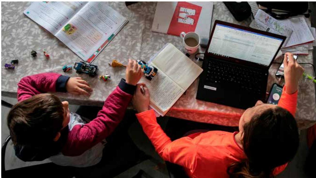
MADRES ESTRESADAS EN LA PANDEMIA.

así como el acompañamiento a los propios hijos en la realización de sus tareas.