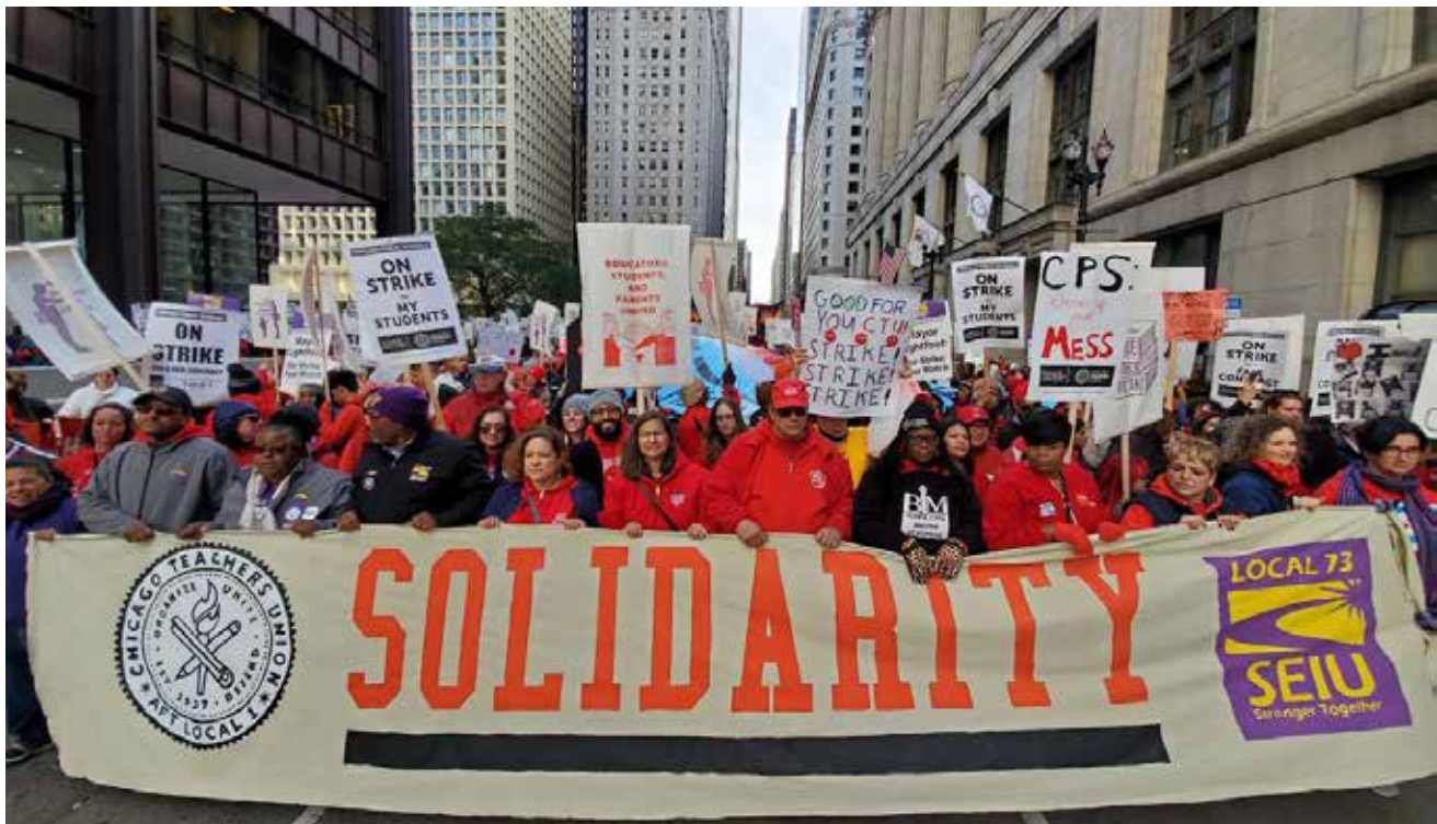
PROTESTAS EN CHICAGO.

Hace veinte años, Chicago estaba inmerso en uno de los mayores -y más equivocados- experimentos jamás realizados para reformar a la educación pública en Estados Unidos. Se trataba de un intento por remodelar completamente a las escuelas de la ciudad a imagen y semejanza del mercado, haciendo hincapié en la competencia entre ellas, la retribución basada en el mérito y un desastroso juego de “supervivencia del más fuerte” mediante el cierre de las escuelas que no obtuvieran buenos resultados en los exámenes o que no cumplieran determinados criterios establecidos por la clase empresarial. Si hubiera tenido éxito, habría transformado a Chicago en lo que más tarde se convertiría en la nueva normalidad en Nueva Orleans, donde la ciudad cambió sus escuelas públicas por charters, después de que los “reformadores” se afianzaran tras el huracán Katrina en 2005.